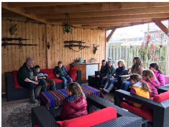
De gezamenlijke introductie van de jeugdactiviteit