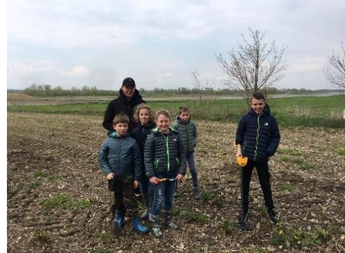
De jongens van groep 6 in het veld