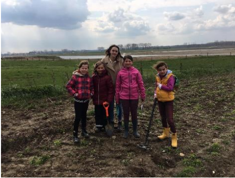
De meiden van groep 6 in het veld